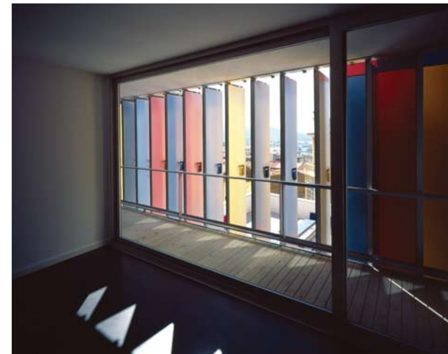
Vivienda de Promoción Privada, Ceuta

Dentro de España ha existido un interés muy particular por establecer y romper con los esquemas de la vivienda