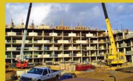
Jardín Las Catalinas Elderly Housing - Caguas

www.gvgbuilders.com gvgbuilders@gmail.com Tel/Fax: 787-777-3976