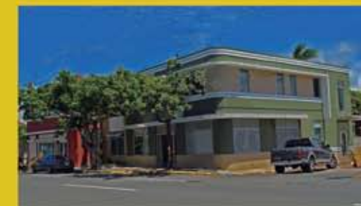
Buildings 900-902 Restoration - Fdez. Juncos Ave.