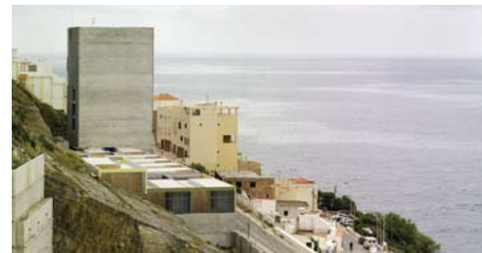
Viviendas de Protección Oficial, Monte Hacho, Ceuta (Concurso European V)

¿Cuál ha sido la importancia de los concursos en sus oficinas y en la arquitectura? Como comentábamos al principio de esta entrevista, somos profesores de universidad y esto nos obliga a ser éticos con nuestra profesión. Nuestro estudio de arquitectura, lejos de ser un estudio comercial y fuente de ingresos, es más bien un pequeño laboratorio donde ponemos